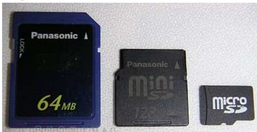
SD Memory Card